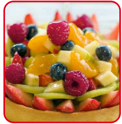
Tartelettes aux fruits