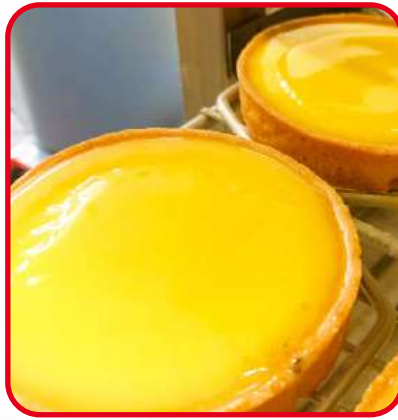
Tartelettes au citron