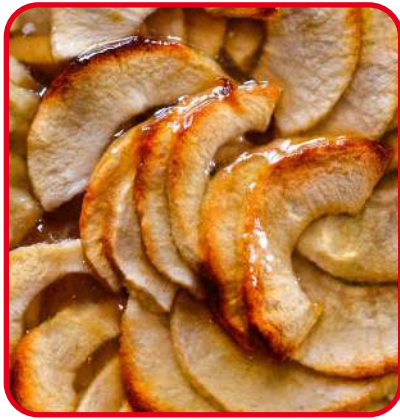
Tartes aux pommes