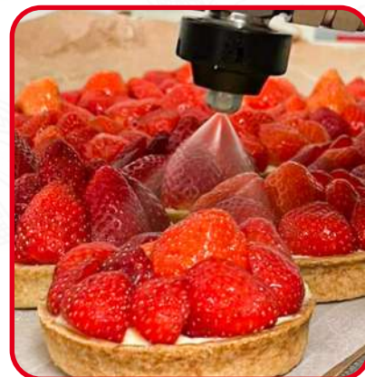
Tartelettes aux fraises