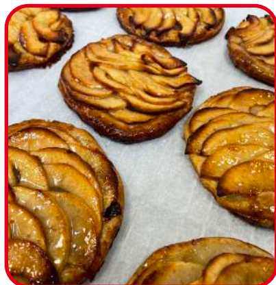
Tartes aux pommes