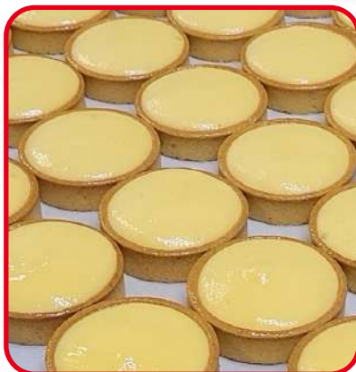
Tartelettes au citron