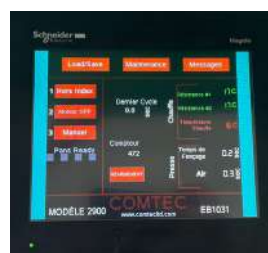
Contrôle digital et programmation de la production

*La mise au point de la pâte reste sous l'entière responsabilité de l'utilisateur