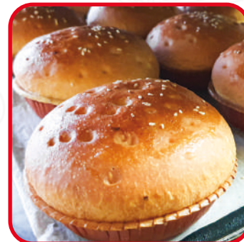
Burgers / Buns