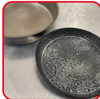
Agent de démoulage