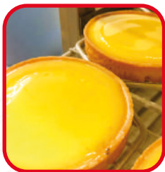
Tartes au citron