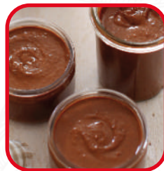
Pâtes à tartiner