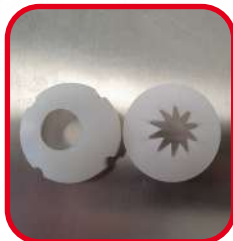
Douille lisse et cannelée