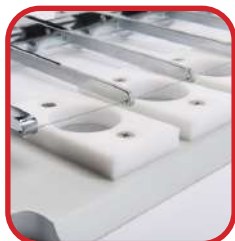
Règle pour coupe fil 6 sorties