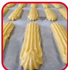
Pâtes à choux