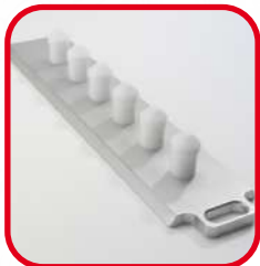
Règle fixe 6 sorties