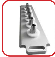
Règle avec douilles inox