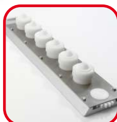
Règle rotative 6 sorties