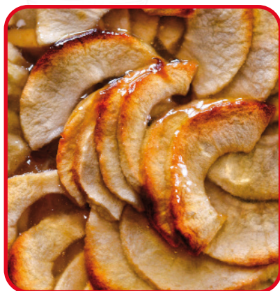
Tartes aux pommes