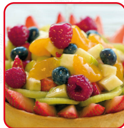
Tartelettes aux fruits