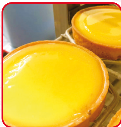
Tartelettes au citron