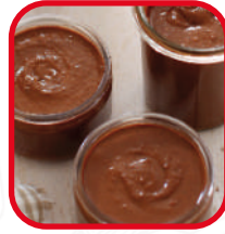
Pâtes à tartiner