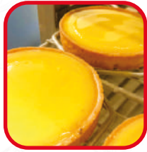
Tartes au citron