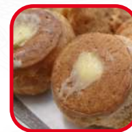
Pâte à choux