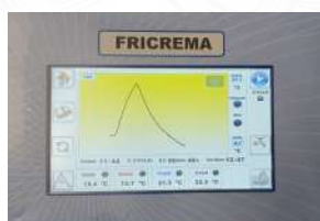
Information cycle en cours