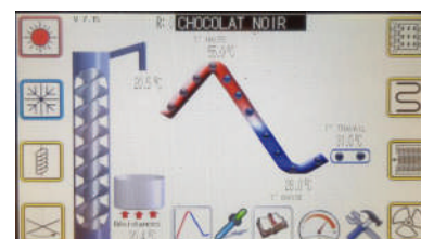
Cycle de tempérage