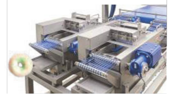
Ligne de trempage multicolore